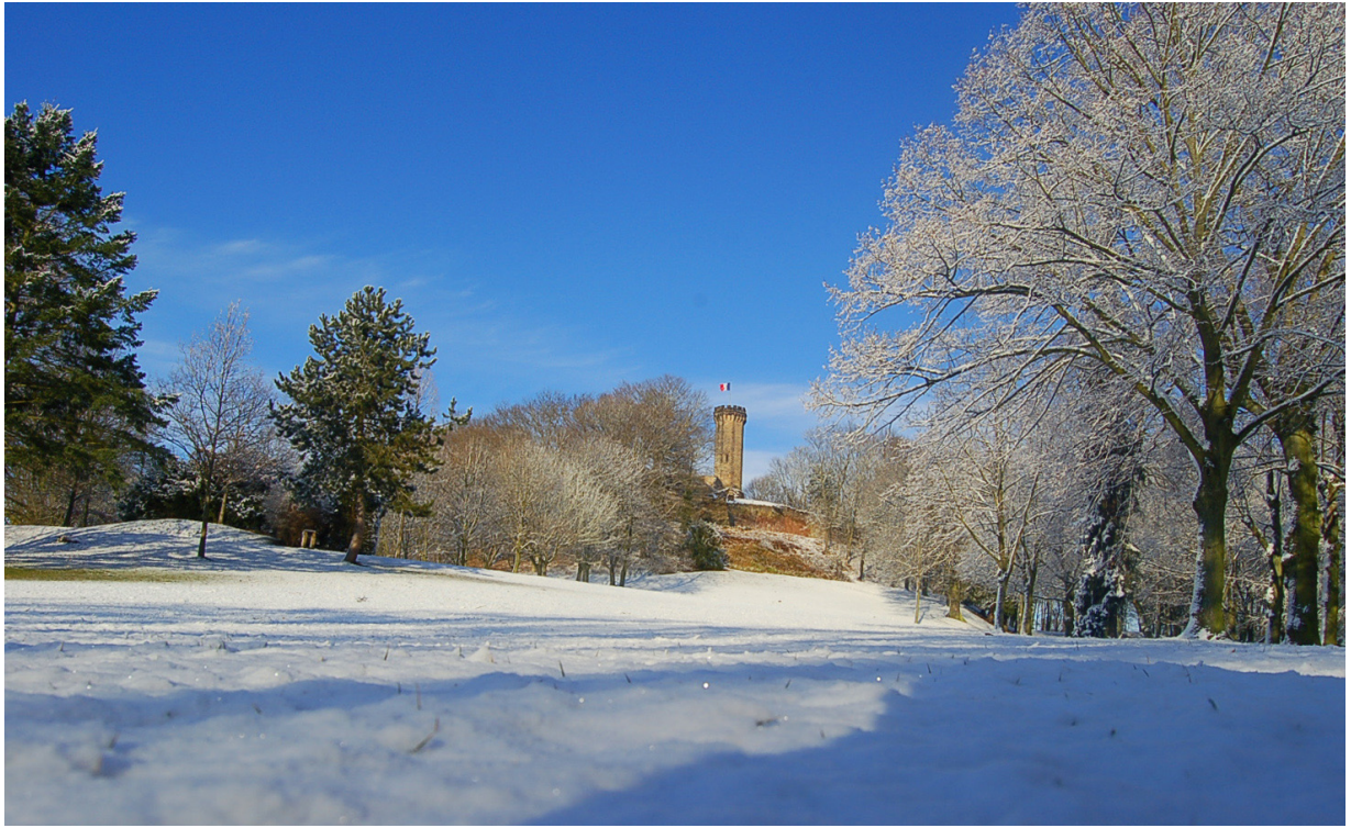
Schlossberg sous la neige