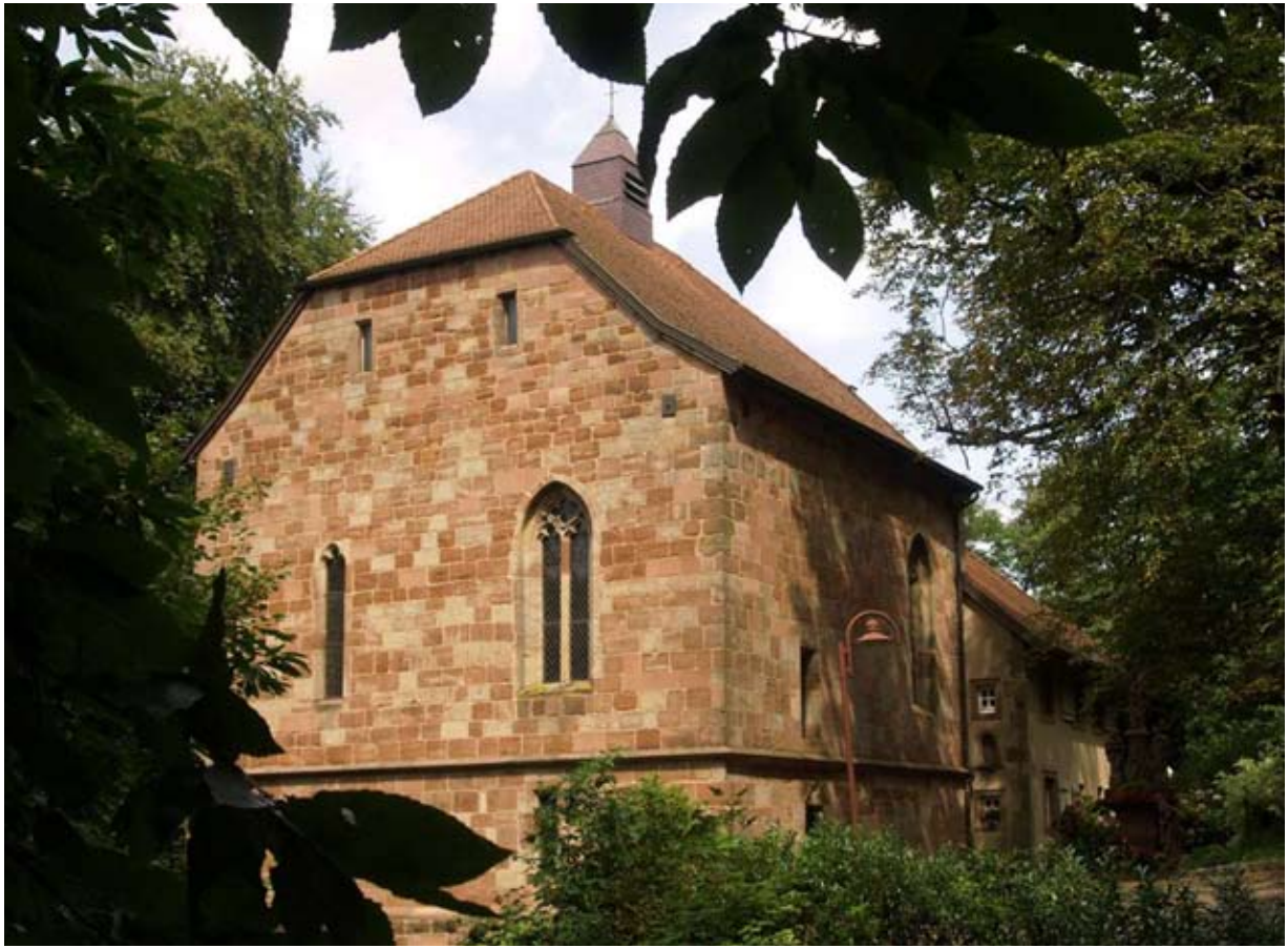
Chapelle dans les feuillages